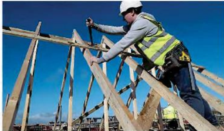
L'urbanisation, un sujet complexe en pays d'Auray sur lequel planchent les élus...

La modification concerne les 23 communes littorales (1) du Pays d'Auray, terrains qui comprennent les intercommunalités de Belle Ile et Auray Quiberon.